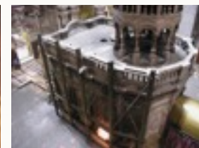
Il-Qabar ta' Kristu