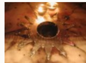
Il-Bażilka ta' Betlehem.