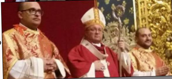
Għal videos, ritratti u omelija sħiħa mur fuq www.ofm.org.mt