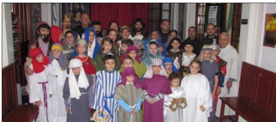
Attività kienet marbuta maż-żmien speċjali tal-Passjoni, l-mewt u l-qawmien ta' Ġesù li tiċċelebra l-Knisja universali.

Din l-attività saret għall-ewwel darba u kienet animata kollha kemm hi mit-tfal. Kienet imqasma f'tappi u f'postijiet differenti. Matul it-triq kien fiha waqtiet ta' mużika, qari mill-Vanġelu u mimi. Hadu sehem il-kor tal-Knisja kif ukoll is-Salesian Boys' Brigade.